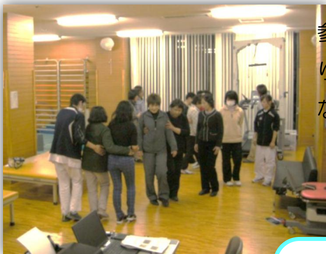
歩行介助の練習の様子

平成25年12月18日18時30より、第14回リハセンター公開講座を開催しました。今回の公開講座はメインテーマを「Let'sサポート 脳卒中編 能力を引き出すためのヒント」とし、PT部門では「脳卒中片まひ者への歩行支援」をテーマに情報提供を行いました。